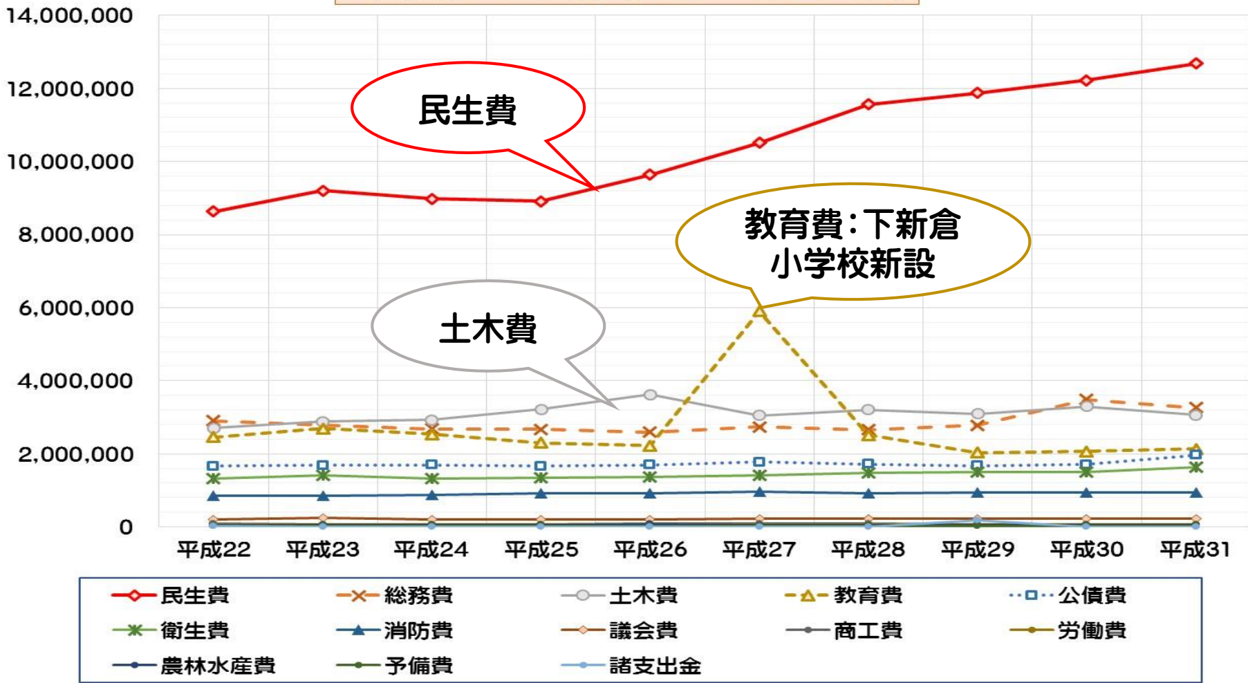
一般会計 歳出額の推移 (単位：千円)

各歳出は、国県支出金、地方債、その他(使用料、負担金)などと一般財源によって賄われます。福祉、土木費などは、市と国県で負担割合が決められているものがあり、それによって支出が決まってきます。